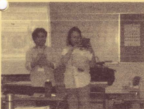
◆最近流行りのスリングを使って