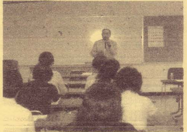
◆人気の須賀先生の講座

保育講習に参加された方々に「どんな提供会員になりたいですか？」と質問したところこんな答えが返ってきました。今回はその一部をご紹介します。