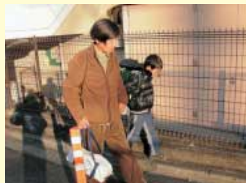
手をつないで仲よし