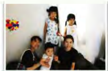
依頼会員Kさんご家族と提供会員Iさん