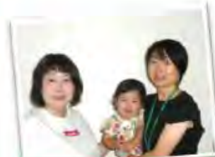
提供会員Hさんと 依頼会員SさんとYちゃん