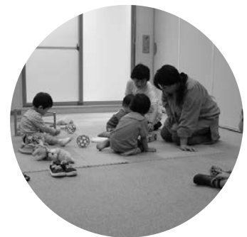
講義中、子どもたちは 楽しく遊んでいました。