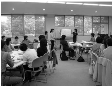
真のサポーターとは？