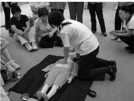
最近は地震も多いので万一のためにも